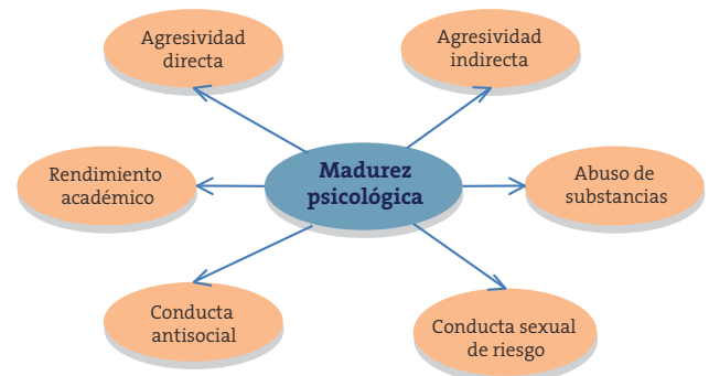
Figura 2. VARIABLES RELACIONADAS CON LA MADUREZ PSICOLÓGICA

Los adolescentes de los casos 3 y 4 presentan pseudomadurez, pero de diferente manera. El caso 3 es independiente pero poco responsable, busca libertad sin asumir las consecuencias. El caso 4 es responsable, asume sus obligaciones, pero no se conoce bien a sí mismo, lo que puede implicar inseguridad y dificultades para tomar decisiones sobre su futuro.